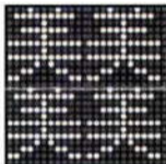
12×12ドット(ゴシック体)