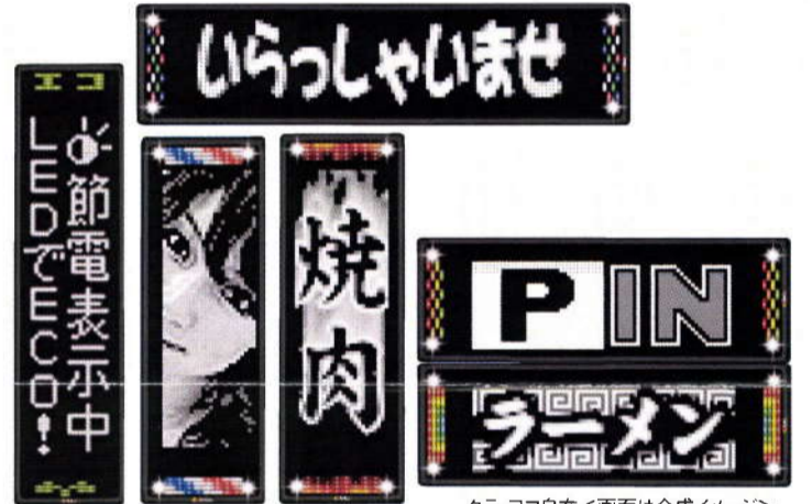
タテ・ヨコ自在な画面は合成イメージ

文字から画像まで充実した動作モードで自由自在に表現が可能です。さらにスタイリッシュでシャープなブラックフレームがコンテンツを一層際立たせます。